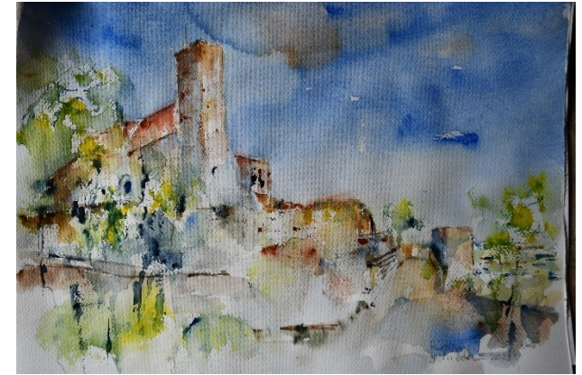
Rietburg (Aquarell, J. Doer, 2023)